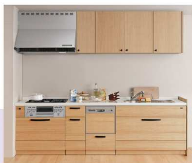
Su;iji torico (7月展示予定)