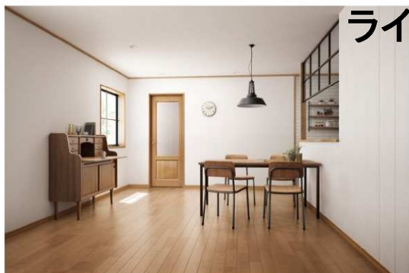
SOFTART ライトブラウン色