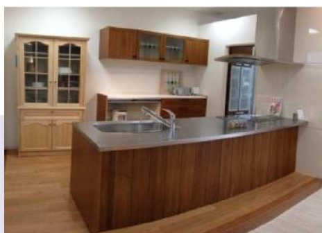
NZ40 パーティー型 ステンレスパイプレーション天板